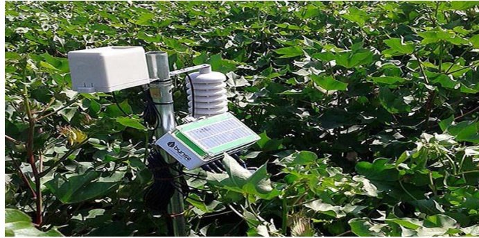
Figura 1. Sensores aplicados en el cultivo.