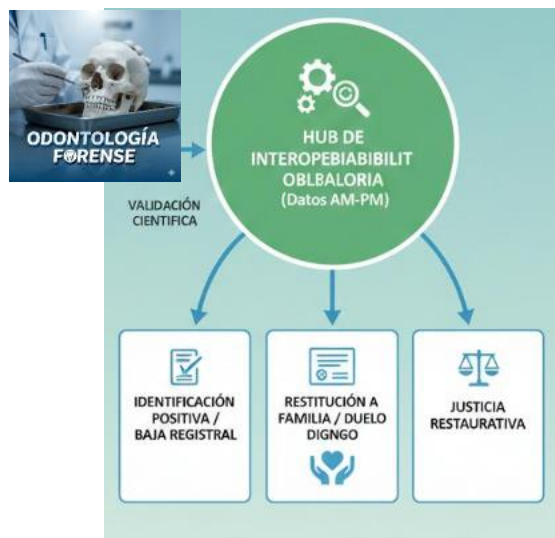
Modelo integrado: cierre de ciclo y reparación