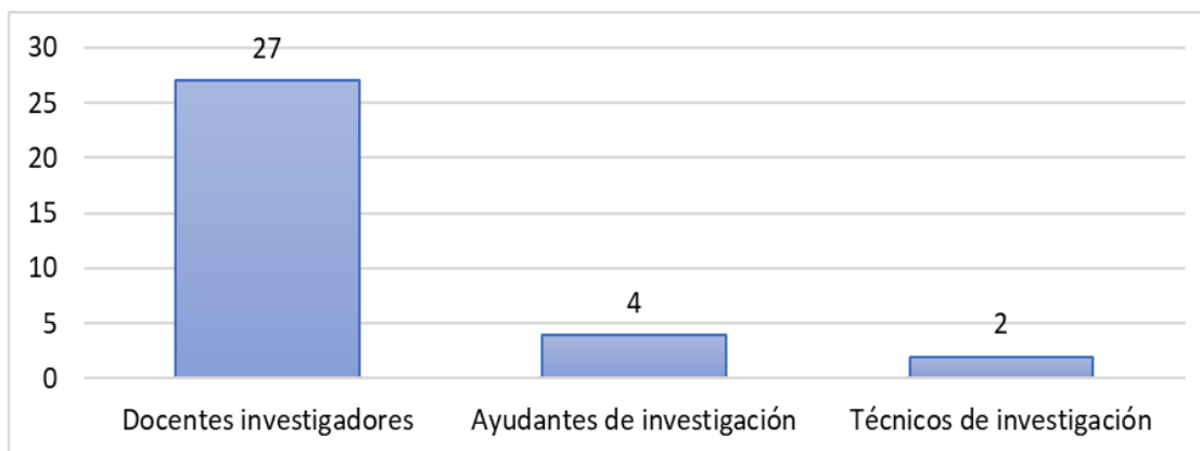
Figura 2. Cuerpo de investigación en el período 2015 – 2020.

Parte de una gestión fortalecida en un departamento de investigación en la escuela de turismo, hotelería y gastronomía, es el activo apoyo para la conformación de grupos de investigación de los docentes, la formación de ayudantes de investigación y técnicos de investigación. Por tal motivo se obtiene como resultado: 27 docentes investigadores, 4 ayudantes de investigación y 2 técnicos de investigación, es importante recalcar que los ayudantes de investigación son estudiantes que se han interesado por la generación de conocimiento, además los técnicos de investigación son estudiantes egresados que buscan aportar y aprender del mundo científico. Obsérvese el detalle en la figura 2.